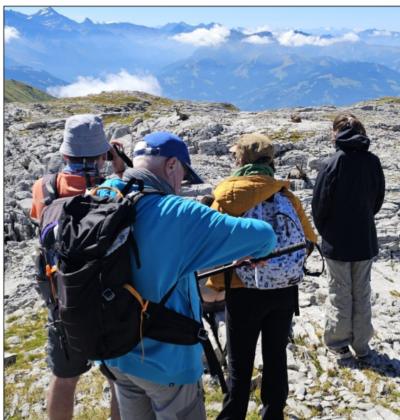
En admiration devant le paysage et les bouquetins