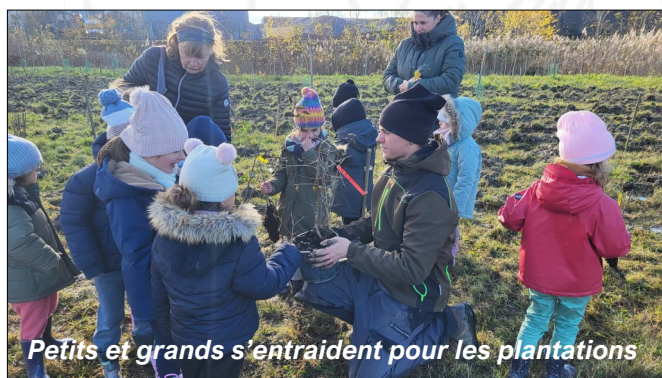
Petits et grands s'entraident pour les plantations

Pendant trois journées — les lundi 17, mardi 18 et jeudi 20 novembre — 1 050 jeunes arbres ont été plantés avec le concours des élèves des écoles de Bassy, Challonges et Usinens, encadrés par les étudiants de la MFR de Bonne et les adultes en formation paysage de l'ISETA. L'association remercie chaleureusement l'ensemble des acteurs ayant contribué à cette opération "1000 arbres".