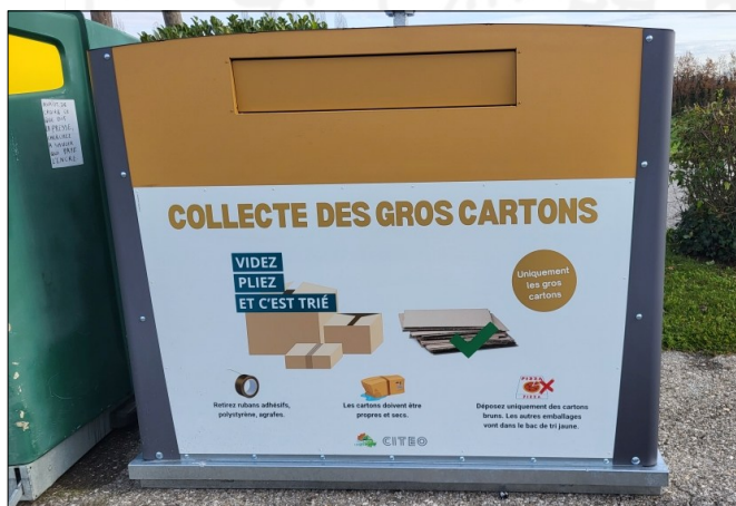
Le nouveau conteneur destiné aux cartons bruns

Enfin, seuls les cartons bruns doivent être déposés dans cette colonne spécifique. Les autres déchets (papiers, journaux, magazines, cartonnets et briques alimentaires) doivent continuer à être jetés dans le bac de tri jaune situé juste à côté.