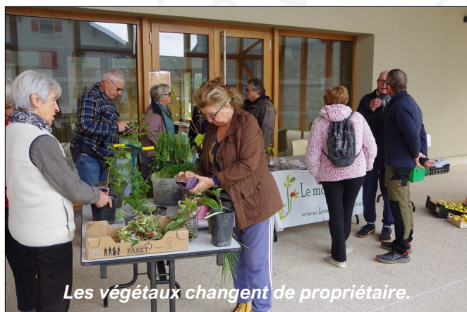
Les végétaux changent de propriétaire.

Le samedi 18 octobre, le parvis de la salle communale a accueilli le troisième Troc de plantes d'automne. Tout au long de la matinée, de nombreuses graines et végétaux ont changé de mains, pour le plus grand plaisir des jardiniers et de leurs jardins.