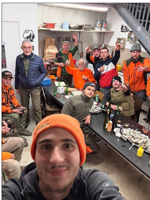
Les chasseurs dans leur nouveau local

Les chasseurs de l'ACCA ont désormais investi leur nouveau local dans le bâtiment communal. Après quelques aménagements réalisés pour optimiser l'espace, il est désormais pleinement opérationnel et apprécié des membres.