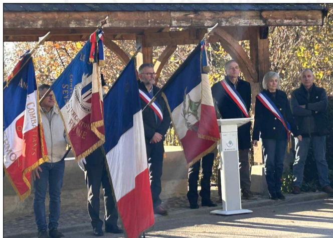
La cérémonie du 11 novembre à Bassy

À l'issue de la cérémonie, la municipalité de Bassy a convié l'ensemble des participants à partager le vin d'honneur à la salle des fêtes.