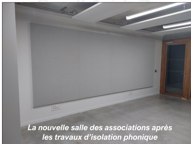
La nouvelle salle des associations après les travaux d'isolation phonique

Pour rappel, cette salle peut être mise gratuitement à la disposition des associations communales, dans le cadre d'une convention définissant les conditions d'utilisation.