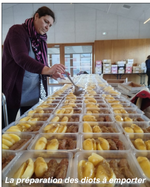
La préparation des diots à emporter

Le dimanche 23 novembre s'est tenue à Bassy la vente de diots à emporter (480 menus adultes et 70 menus enfants), dont les bénéfices contribuent au financement des projets menés par les trois écoles. En 2024-2025, ces fonds ont permis aux élèves de participer à de nombreuses activités : spectacles 3 Chardons et Zygomatik , piano itinérant, découverte du Marais de Lavours et des bords du Rhône, cross de Seyssel, stage de voile, séjour en yourtes, visite du collège, semaine du goût ou encore initiation au basket en fauteuil roulant. Au total, ces actions représentent un coût de 21 000 €. Nous avons également pu offrir aux CM2 leur calculatrice pour l'entrée au collège.