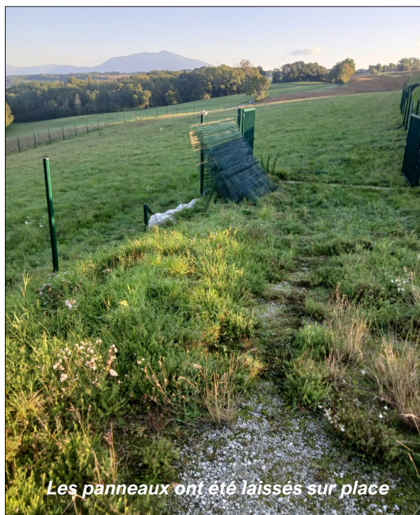
Les panneaux ont été laissés sur place

Ces actes regrettables rappellent non seulement le risque sanitaire que fait peser toute atteinte à une installation de captage, mais aussi leurs conséquences financières pour la collectivité : malgré la prise en charge par l'assurance du coût des travaux (d'un montant de près de 9 000 €), une franchise de 500 € reste à la charge de la Commune.