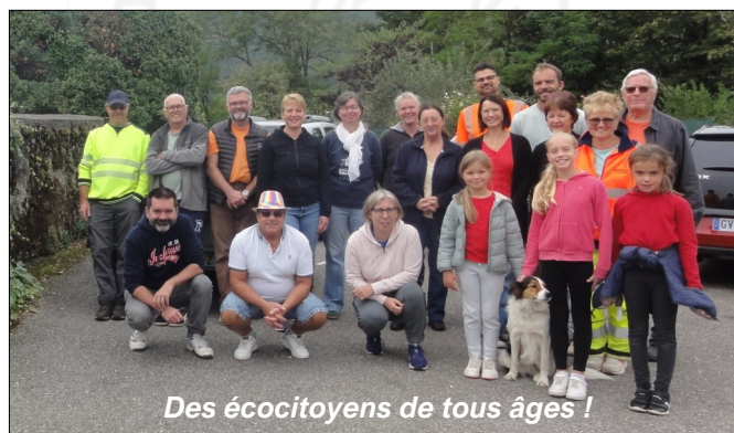
Des écocitoyens de tous âges !

Le samedi 13 septembre, une trentaine de bénévoles se sont mobilisés pour la matinée de nettoyage d'automne des abords des routes et chemins communaux, ce qui constitue un record de participation. Habituellement organisée lors de la journée mondiale de nettoyage de la planète, cette édition a été avancée d'une semaine afin de ne pas coïncider avec le week-end des Journées du Patrimoine, et de ne pas empiéter sur la période de chasse. De tous âges, habitués fidèles ou nouveaux venus, chacun a contribué à ce moment convivial et utile pour le village.