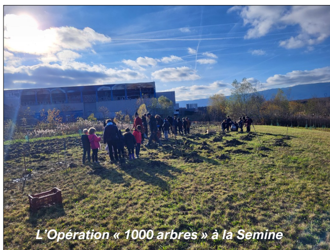
L'Opération « 1000 arbres » à la Semine

Pour finir, nous avons pique-niqué sur des bottes de paille, c'était rigolo ! Et nous avons dégusté des fromages locaux ainsi que des yaourts. C'était trop bien !