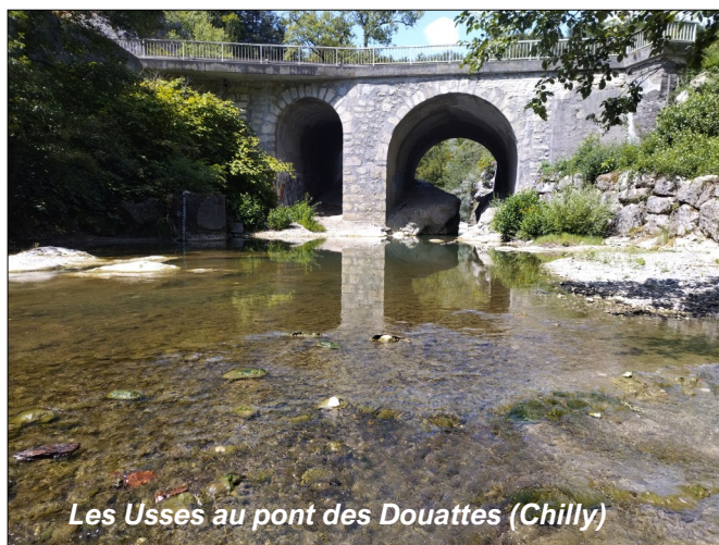
Les Usses au pont des Douattes (Chilly)

Retrouvez toutes les actualités du Syndicat de rivières sur le site internet : www.rivieres-usses.com et sur la page Facebook Syr'Usses – Syndicat de rivières Les Usses.