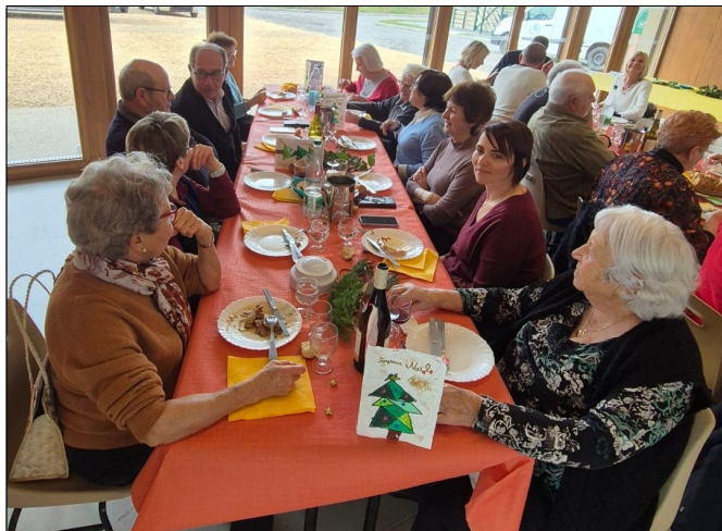
Un moment d'échanges apprécié de tous