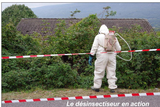
Le désinsectiseur en action

Les signalements doivent se faire sur la plateforme officielle : www.frelonsasiatiques.fr , pour que l'alerte soit diffusée auprès des référents « frelons » et qu'un désinsectiseur intervienne rapidement.