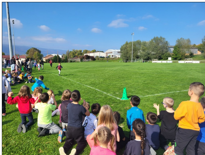
Le cross à Challonges

Le vendredi 17 octobre, nous sommes allés au stade de Challonges pour participer au cross avec la classe des GS/CP de maîtresse Nathalie, ainsi que les deux classes des grands d'Usinens de Gaëlle et Cécile. Nous avons couru plusieurs tours de stade mais tout le monde a réussi ! Après, ce fut l'heure du goûter avec les autres classes !