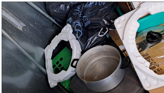
Quelques exemples de dépôts sauvages...

Nous appelons chacun à faire preuve de civisme : respectez le tri sélectif et utilisez les conteneurs appropriés. La propreté de notre commune dépend de l'effort de chacun.