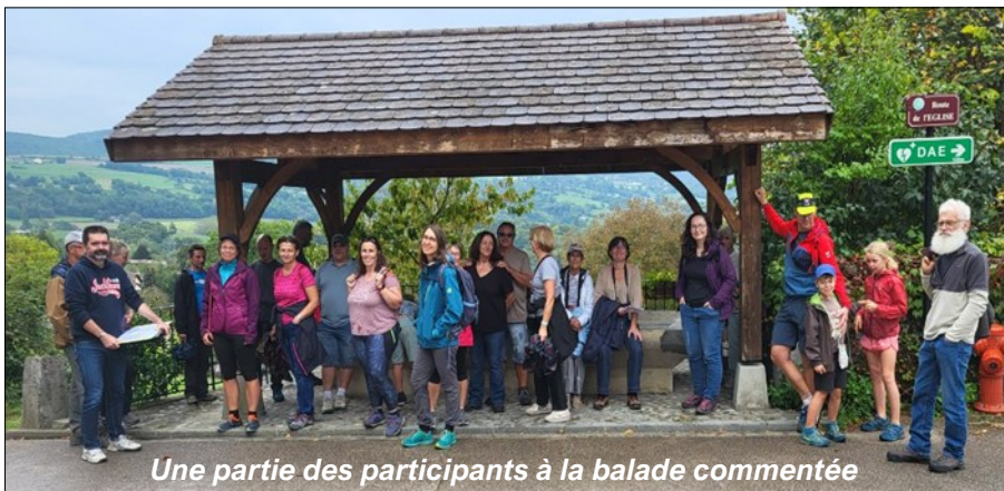
Une partie des participants à la balade commentée

La municipalité remercie chaleureusement tous les intervenants, ainsi que les participants pour leur présence et leur intérêt.