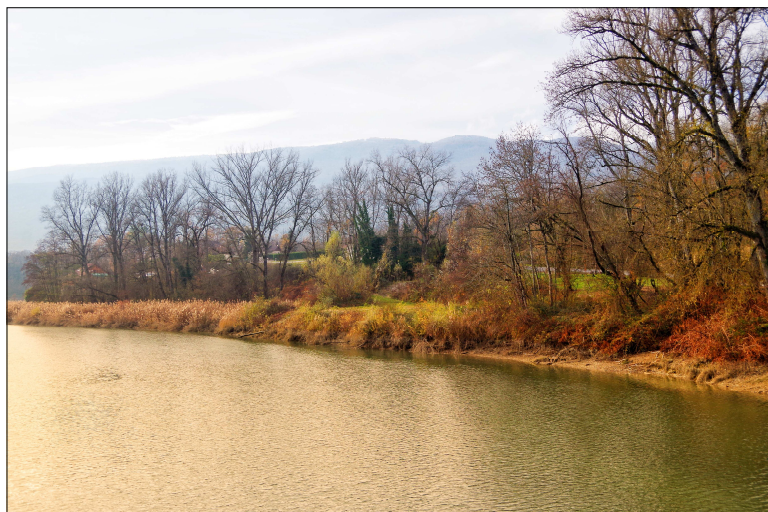
Le Regonfle, vu du Pont de Bassy

Les travaux d'entretien et la pose des équipements sont réalisés en interne par la Commune, sans faire appel à des prestataires. Une aide au financement de ce projet de mise en valeur a été sollicitée auprès de la Compagnie Nationale du Rhône, pour un montant s'élevant à 25% du coût des opérations.