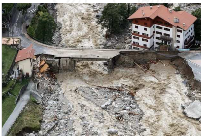
Vue aérienne de Saint-Martin-Vésubie, après le passage de la tempête Alex

Pour témoigner de la solidarité des 413 habitants de Bassy envers les populations sinistrées, une subvention de 1000 € a ainsi été votée, et versée à l'association des maires des Alpes-Maritimes, sur un compte dédié à cette action. L'association des maires se charge ensuite de redistribuer les dons, pour tenter d'apporter des solutions rapides aux situations les plus urgentes.