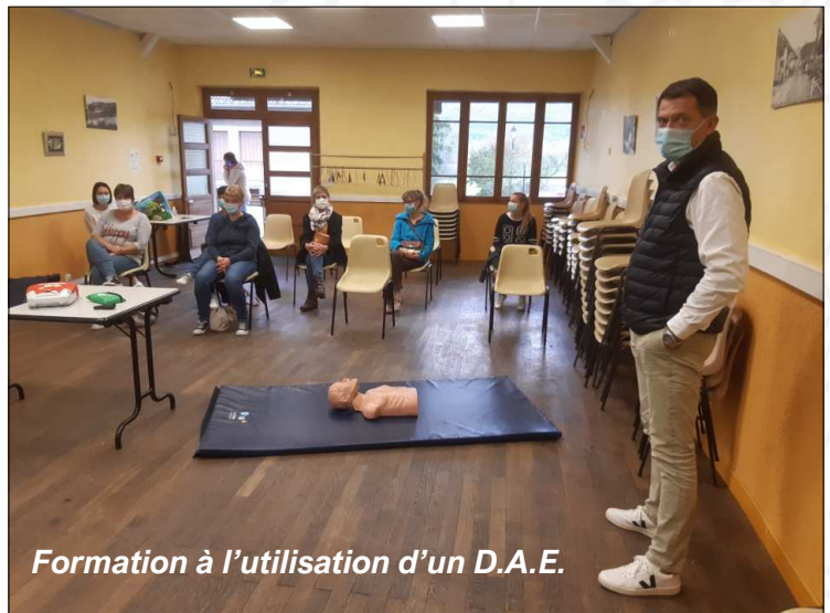
Formation à l'utilisation d'un D.A.E.