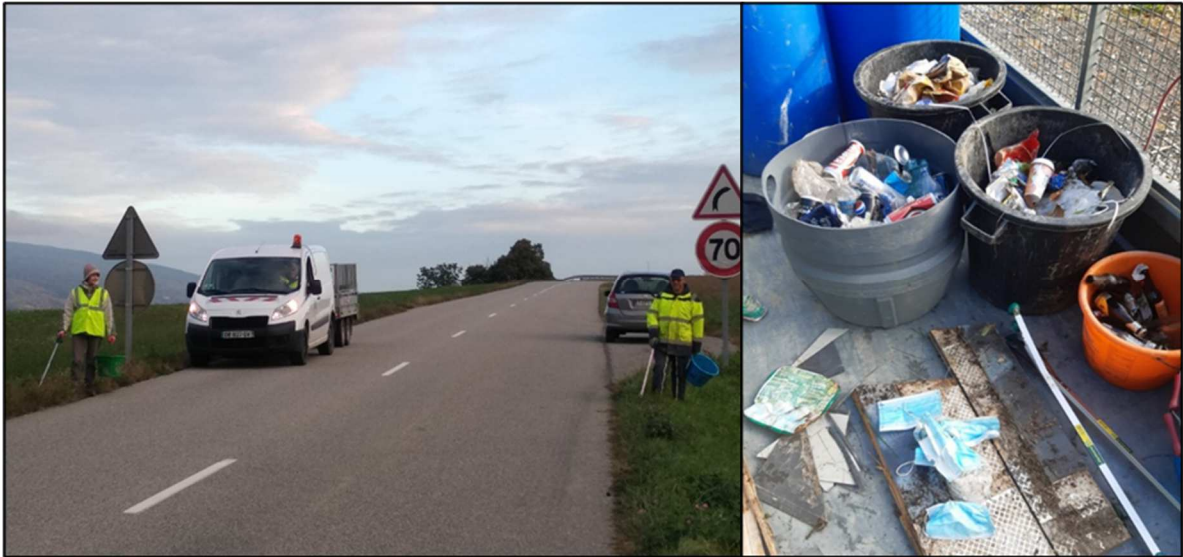
L'équipe des bénévoles en action, et le résultat de leur « récolte ».

Il reste à espérer que cette action éco-citoyenne alerte ceux qui abandonnent des déchets dans la nature, et mobilise d'autres volontaires pour participer à une prochaine balade-nettoyage, organisée sous l'égide de la Mairie.