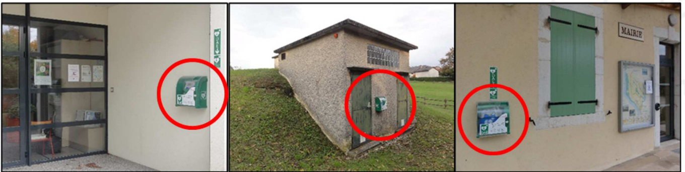
Localisation des DAE : à l'école, au réservoir de Veytrens et à la Mairie.

Deux défibrillateurs sont installés au Chef-lieu (un à la Mairie, un à l'école), et un troisième est mis en place à Veytrens, sur le réservoir situé au bord de la RD14.