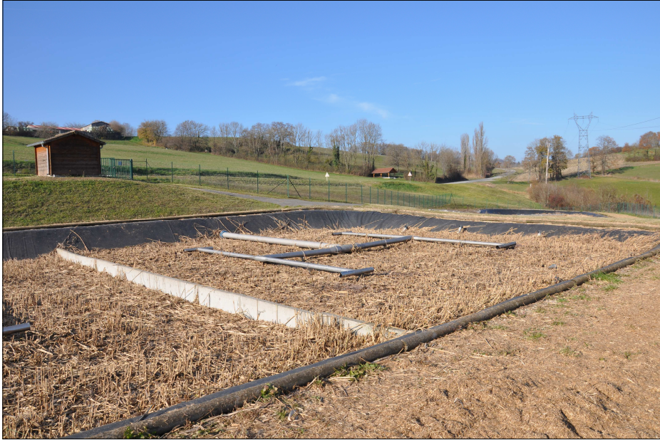
La station d'épuration de Bassy.

Outre la gestion courante du réseau, la CCUR travaille également à son renouvellement et à son extension.