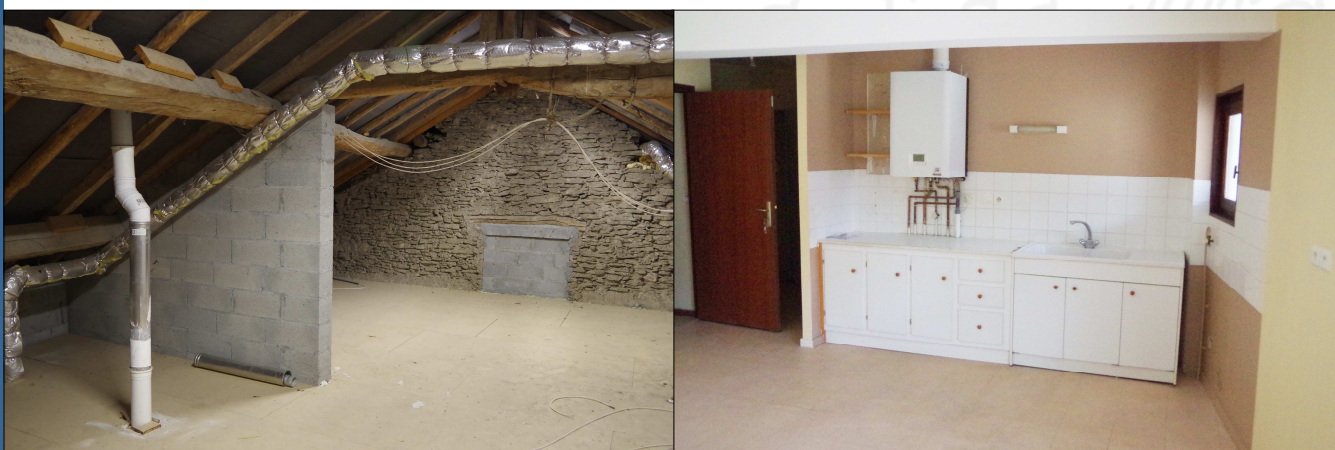
Les combles et l'appartement T2 vont faire l'objet d'un réaménagement.

Suite au départ du locataire occupant l'appartement T2 situé au-dessus du restaurant « La Grange », le Conseil municipal a décidé de rénover ce logement, et d'aménager les combles situés au second étage. Pour l'assister dans ce projet, un cabinet d'architectes a été missionné afin de proposer différents scénarios d'aménagement, et procéder à un premier estimatif du coût des travaux par corps de métiers.