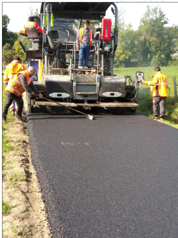
Goudronnage de la Route de Châtel