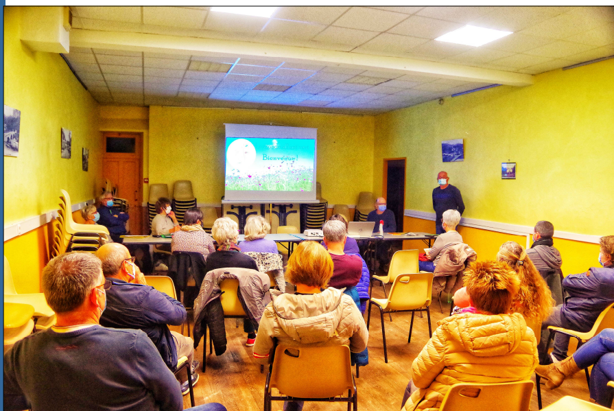
Réunion d'information organisée le vendredi 16 octobre

Comme annoncé dans le dernier numéro du P'tiou Basseyrans, nous avons organisé une réunion d'information le vendredi 16 octobre, afin de présenter les motivations et les objectifs de notre association « Le monde allant vert », et à laquelle a assisté une vingtaine de participants.