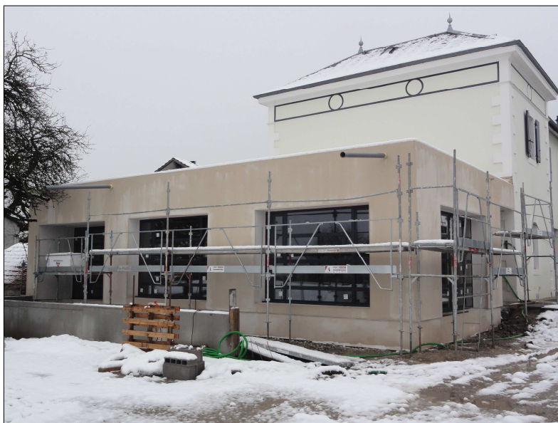
Le chantier de la future cantine au début du mois de décembre

Pour rappel, la réception est programmée au mois de mars 2021.