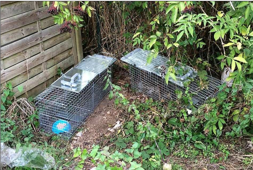
Pièges pour chats errants.

C'est aux Municipalités que revient la gestion des chats divagants (elles seules sont autorisées à les capturer, les stériliser et les identifier). Depuis 1999, une alternative à la mise en fourrière (et à l'euthanasie qui généralement s'ensuivait) a été mise en place avec l'officialisation du statut de