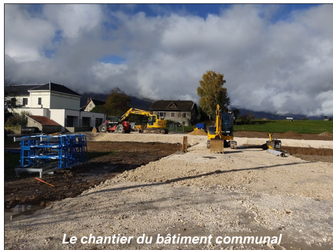
Le chantier du bâtiment communal

La grue ainsi qu'une « base de vie » pour les ouvriers sont mises en place ce mois de décembre, juste avant que ne débutent les travaux de maçonnerie.