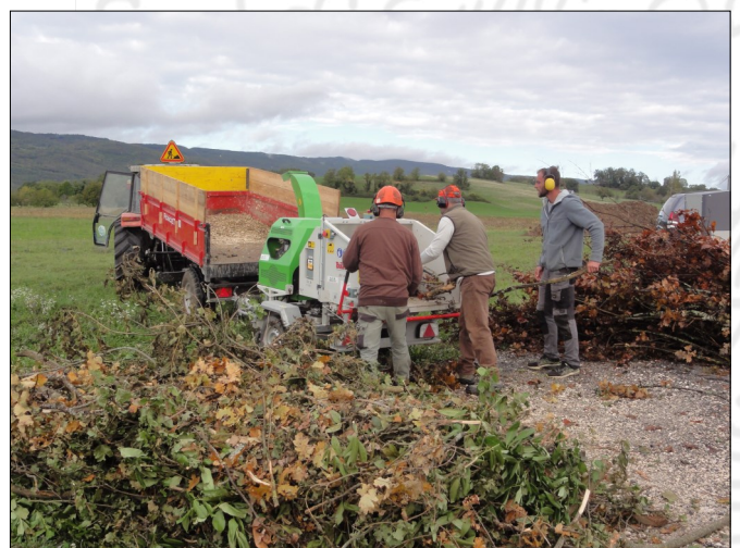
Les déchets végétaux de la Commune ont été broyés

La matinée "broyage" organisée le samedi 21 octobre n'a pas obtenu le succès escompté (contrairement au troc plantes du Monde allant vert organisé en même temps, qui a trouvé son public). Elle a néanmoins permis à la Commune de broyer ses propres déchets végétaux et des branches d'arbres récemment tombés. C'est pourquoi il est acté que cette matinée sera reconduite en 2024, pour que la Commune puisse de nouveau procéder au broyage de ses déchets verts. Des ajustements dans l'organisation sont toutefois étudiés par le Comité environnement, afin que cette matinée ne profite pas seulement à la Commune mais au plus grand nombre.