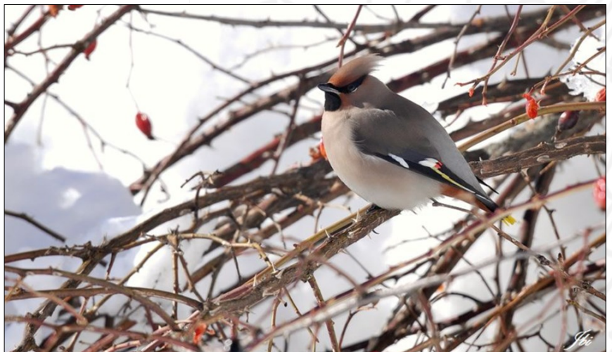
Jaseur boréal (Plaine Joux, 74)

La dernière observation connue sur Bassy date de 2009 : une trentaine d'individus observés vers midi entre Bassy et Veyrens sans autre précision. Sans doute cette année-là, une mauvaise fructification dans les quartiers d'hiver habituels les aura poussés à descendre vers le sud en quantité plus grande qu'à l'ordinaire. A moins qu'après plusieurs saisons de bonne reproduction, certains ont déferlé par crainte de la famine. Pour ces grands amateurs de petits fruits, le salut est dans l'émigration. Cette année il semblerait qu'ils aient opté pour la Grande-Bretagne. Seront-ils les avant-coureurs d'autres vagabonds qui progresseront jusque dans l'est de la France et les Alpes ?