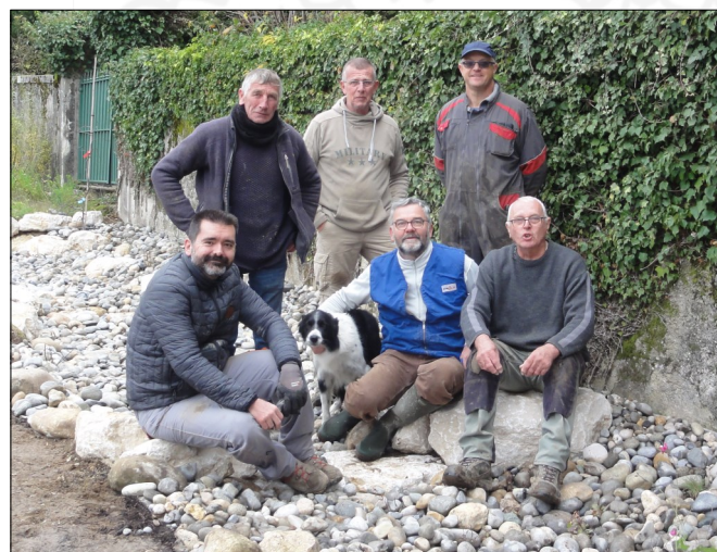
Les "gros bras" et leur mascotte : Lucky !

Quant à la Vierge de Charmy, les plantations ont été faites au mois de novembre. La mise en place de deux bancs en bois autour de la statue se fera dans le courant de l'hiver.