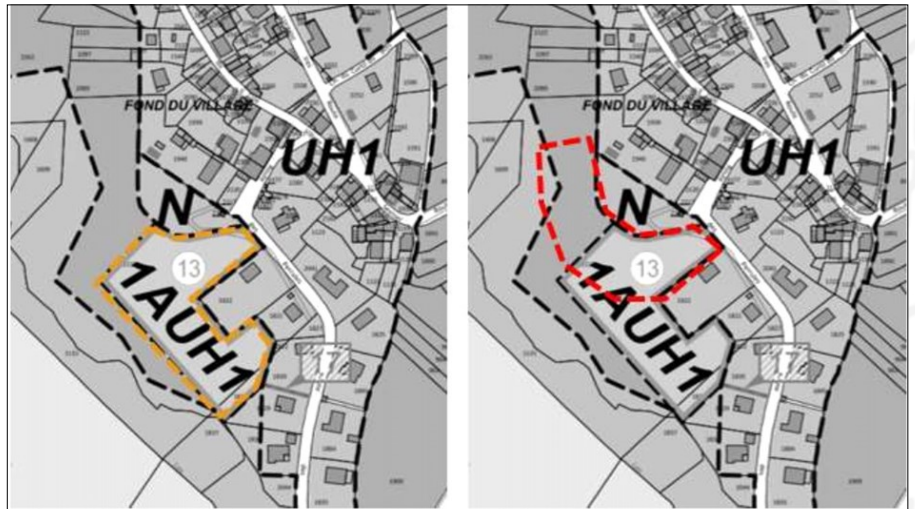
Evolution du périmètre projet (à gauche : tracé actuel / à droite, nouveau tracé)

Dès les premières investigations, il est apparu que le périmètre actuel de l'OAP du Fond du village, tel qu'il figure dans le PLUi, n'était pas adapté pour un tel aménagement, en raison d'une mauvaise qualité des sols (en particulier dans sa partie basse), qui aurait nécessité des surcoûts pour les fondations. Il a donc été proposé de le décaler un peu vers le nord, en dessous de l'aire des jeux des Perrules.