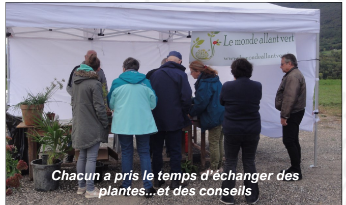
Chacun a pris le temps d'échanger des plantes...et des conseils

Quelques végétaux n'ont pas trouvé preneur : ils rejoindront de nombreux autres lors du troc graines/troc plantes qui aura lieu début mars 2024 sous la Grenette de Seyssel.