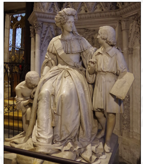
La statue de la princesse de Savoie

En entrant dans l'église, le visiteur est immédiatement surpris : quel que soit l'endroit où se porte son regard, un décor original l'accapare. C'est un véritable concentré de chefs-d'œuvre : des dentelles en pierre de Seyssel, des statues, des cénophes (monuments funéraires), des gisants, des autels finement décorés et de magnifiques fresques murales. Mais la merveille des merveilles se situe à gauche en entrant dans la nef. Il s'agit d'une statue de marbre blanc de Carrare, représentant la princesse Marie-Christine de Savoie, entourée d'un mendiant à gauche et d'un jeune artiste à droite. Un véritable exploit artistique car les trois personnages sont sculptés dans un seul et même bloc de marbre, par le sculpteur turinois ALBERTONI. En résumé, une journée vraiment enrichissante !