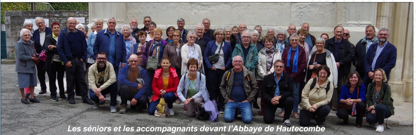
Les séniors et les accompagnants devant l'Abbaye de Hautecombe