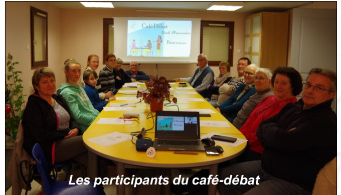
Les participants du café-débat

Des pistes d'améliorations ont d'ores et déjà été intégrées pour le prochain café-débat qui aura lieu le mardi 30 janvier 2024. Il aura pour thème : Découvrir et comprendre la vie du sol.