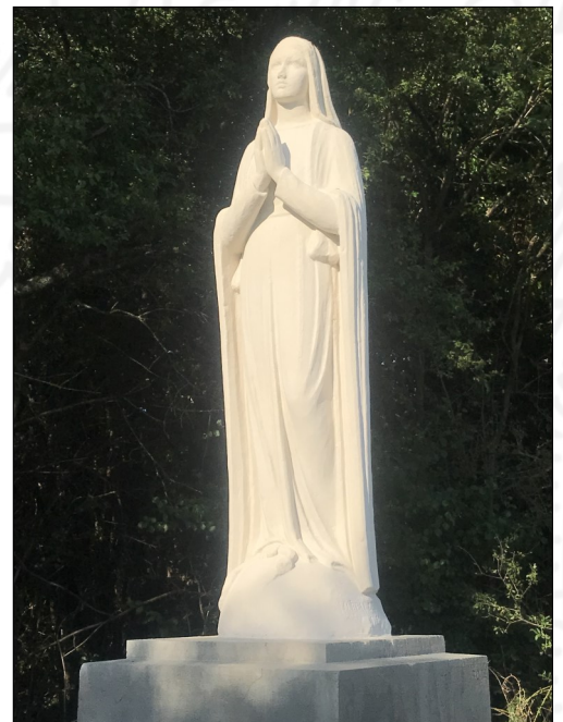
La statue de la Vierge restaurée

Si vous aussi vous souhaitez faire un don, et bénéficier sous certaines conditions d'une déduction de votre impôt sur le revenu, vous pouvez le faire jusqu'au 31 mars 2024, en vous connectant sur le site internet de la Fondation du Patrimoine ( https://www.fondation-patrimoine.org/les-projets/tableau-annonciation-de-bassy ) ou en récupérant un bulletin de souscription à la Mairie.