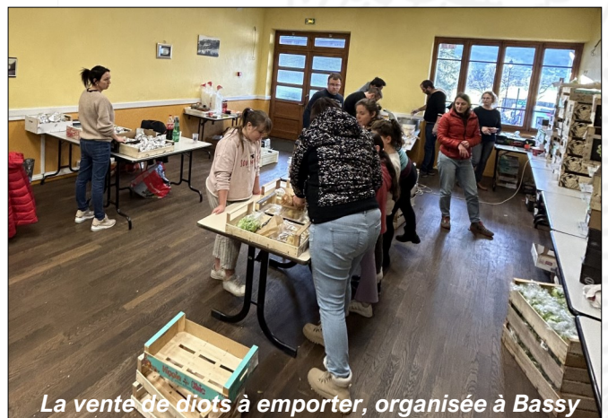
La vente de diots à emporter, organisée à Bassy