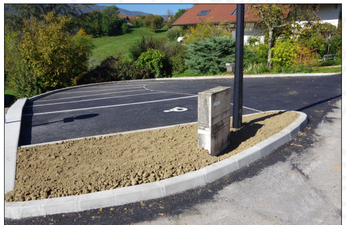
Le parking du Fond du village est achevé

Pour le confort de tous les usagers, nous vous rappelons que son utilisation est soumise au règlement de stationnement entré en vigueur en février 2023 (qui s'applique à tous les stationnements publics de la commune). Vous pouvez le consulter en Mairie ou sur le site internet de la commune (Rubrique « Infos pratiques »).