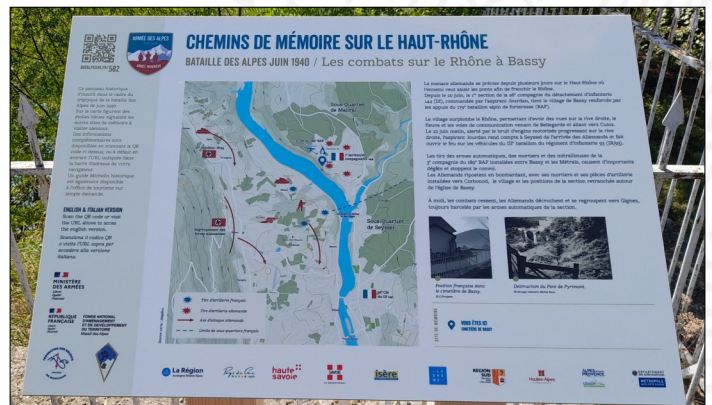
Le panneau du Chemin de mémoire de Bassy

Ce panneau sera officiellement inauguré le samedi 28 octobre à 10h , avec un accueil « café » à partir de 9h30 dans les jardins de la mairie. Toute la population du village est cordialement invitée à participer à cette manifestation.