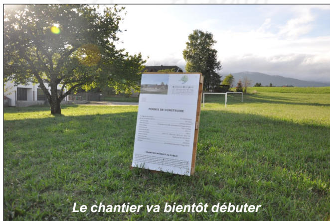
Le chantier va bientôt débuter

D'avance, nous remercions toutes les personnes qui seront impactées pour leur compréhension.