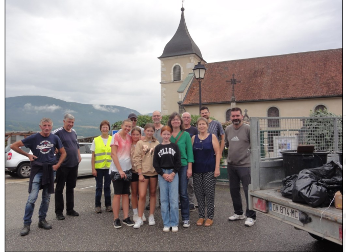
Une partie des participants

Rendez-vous au printemps prochain pour la prochaine matinée de nettoyage !