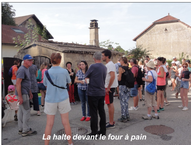
La halte devant le four à pain