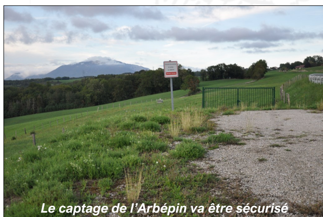
Le captage de l'Arbépin va être sécurisé

Ces travaux, d'un montant de 27 800 € HT, ont été subventionnés à hauteur de 35% par le Conseil Départemental de Haute-Savoie , au titre du Fonds d'aide aux collectivités en matière d'eau et d'assainissement.