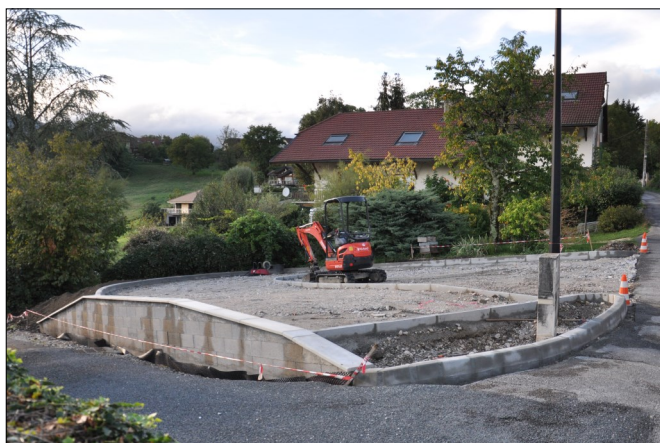
Le chantier du parking

Nous profitons de cet article pour remercier les riverains pour leur compréhension pendant la durée des travaux (bruit, poussière...) et en particulier M et Mme LINÉ qui ont permis aux véhicules de se garer devant chez eux quand l'accès au chantier n'était pas possible.