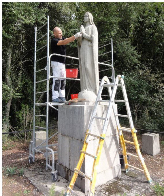
La statue en cours de restauration

La restauration de la statue et de son socle ayant fait l'objet d'un avenant à la convention signée entre la Fondation du Patrimoine et la Commune de Bassy, elle est éligible à la souscription initialement lancée pour la restauration du tableau « l'Annonciation ».