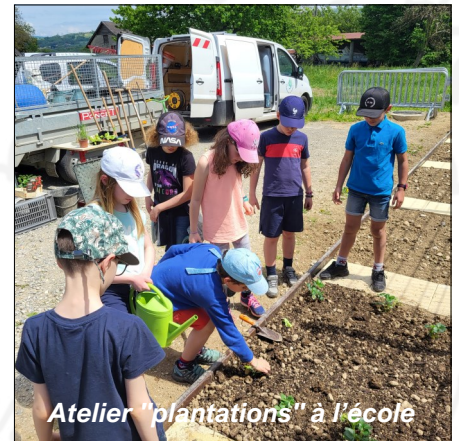
Atelier "plantations" à l'école