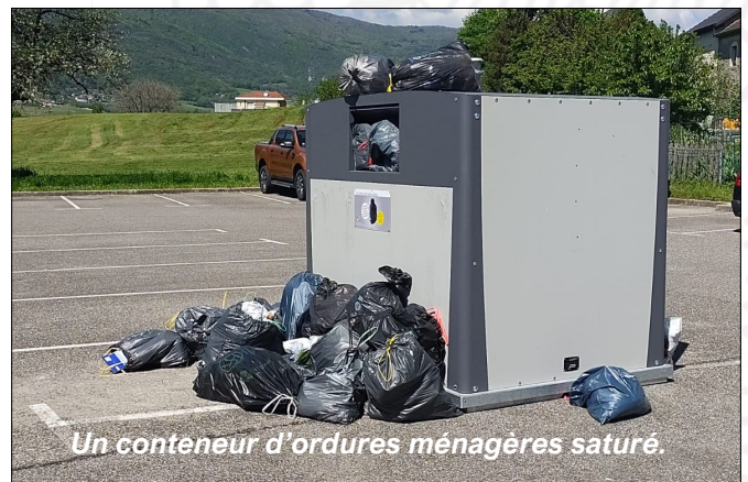
Un conteneur d'ordures ménagères saturé.

Toutefois, nous avons trouvé sur place des sacs contenant des déchets verts, des bouteilles en plastique, et même de la ferraille. Si les nouvelles consignes de tri avaient été respectées, les nuisances rencontrées auraient été moindres. Merci de trier vos déchets et de les déposer dans le conteneur adapté.