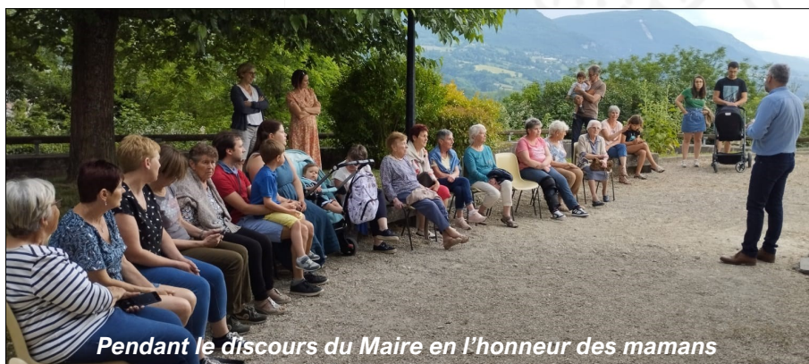
Pendant le discours du Maire en l'honneur des mamans

Toutes les mamans présentes sont reparties avec une rose en cadeau. Une fleur a aussi été offerte aux mamans qui, pour des raisons de santé, n'avaient pas pu se joindre à nous.