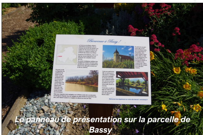
Le panneau de présentation sur la parcelle de Bassy

D'autres travaux seront réalisés dans le courant de l'automne.