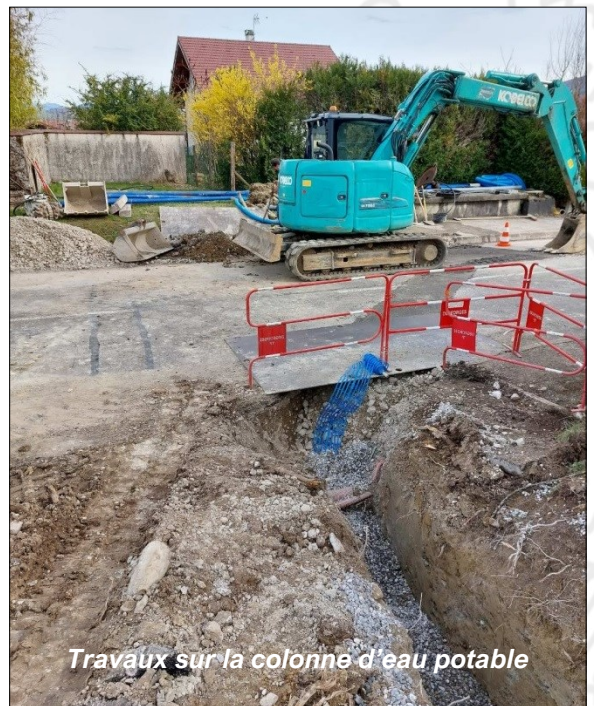
Travaux sur la colonne d'eau potable

L'enjeu quantitatif est aussi pris en compte, avec des interventions régulières sur le réseau pour limiter l'apparition de fuites. Ainsi, la colonne d'eau potable a été changée entre le captage de l'Arbépin et réservoir de Veytrens, pour un montant total d'environ 207 000 €, subventionné à hauteur de 50% par l'Agence de l'eau et 30% par le Département.