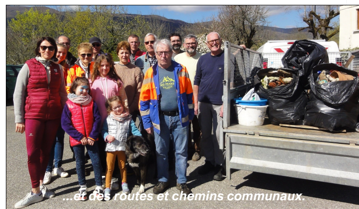
...et des routes et chemins communaux.

Au total ce sont environ 100 kg de ferraille, 100 l. d'ordures, 75 l. de verre et autant de canettes et de déchets plastiques qui ont été récupérés. Ces déchets ont ensuite été triés avant d'être acheminés en déchèterie.