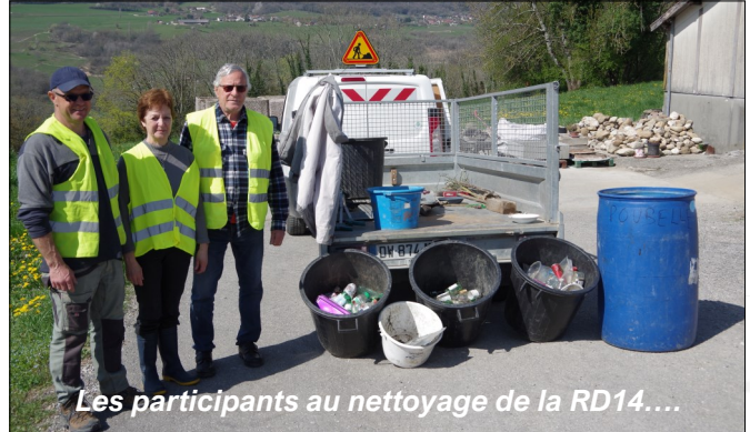
Les participants au nettoyage de la RD14...

Une quinzaine de participants se sont retrouvés pour débarrasser les voiries des sempiternels mégots de cigarette, canettes en aluminium, bouteilles en verre et emballages plastiques jetés par des automobilistes indéclicats. Les quantités récoltées, bien que toujours trop importantes, sont cependant en recul par rapport aux campagnes précédentes, ce qui constitue un motif de satisfaction. Une équipe dédiée a également commencé à évacuer les débris accumulés dans d'anciennes décharges sauvages situées en contrebas de l'église et du cimetière, constituées principalement de vieux pots de fleurs et des restes de couronnes mortuaires, mais aussi d'amas de ferraille jetés il y a plusieurs dizaines d'années.