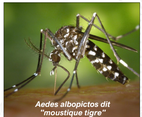
Aedes albopictus dit "moustique tigre"