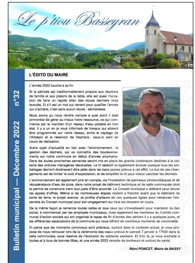
Le bulletin communal est imprimé à 250 exemplaires

Lorsque le sujet le justifie, des réunions d'informations sont également organisées à la salle communale pour discuter avec les habitants des projets structurants pour la commune :