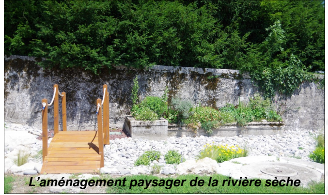
L'aménagement paysager de la rivière sèche

La gestion des déchets , qui relève de la compétence de la Communauté de communes, a connu des changements depuis le début de l'année 2023 (consignes de tri simplifiées, dépôt des ordures ménagères résiduelles dans les conteneurs gros volumes).