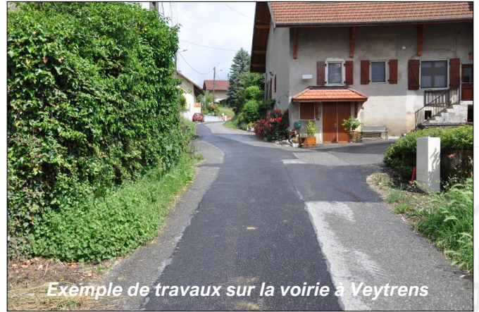
Exemple de travaux sur la voirie à Veytrens

Des interventions ont aussi été réalisées sur le réseau électrique afin de le sécuriser et/ou le renforcer en différents points de la commune :