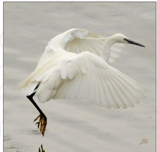
Aigrette garzette, plus petite que sa grande cousine, le bec est noir et les doigts des pattes, jaunes.