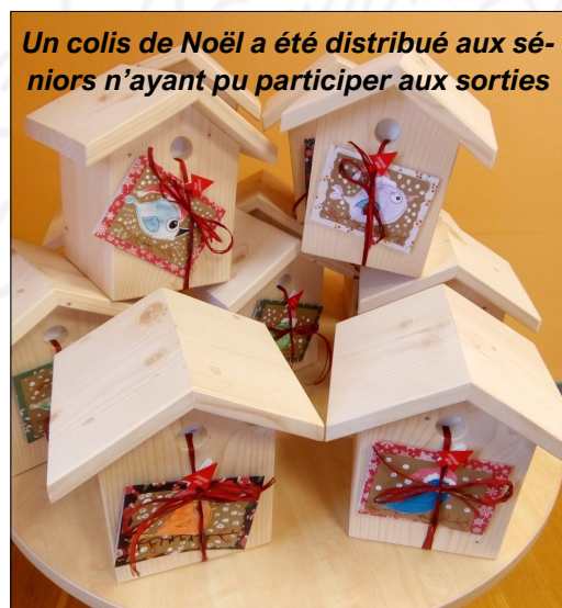
Un colis de Noël a été distribué aux séniors n'ayant pu participer aux sorties

En 2021 et 2022, les sorties ont pu être heureusement organisées : une excursion d'une journée entière a été proposée dans les Aravis en novembre 2021, et un repas a été organisé à l'auberge d'Anglefort en novembre 2022. Les personnes de plus de 75 ans en résidence principale sur la commune n'ayant pas pu participer à ces sorties se sont vues remettre un cadeau.