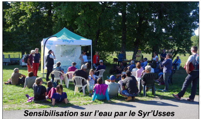
Sensibilisation sur l'eau par le Syr'Usses