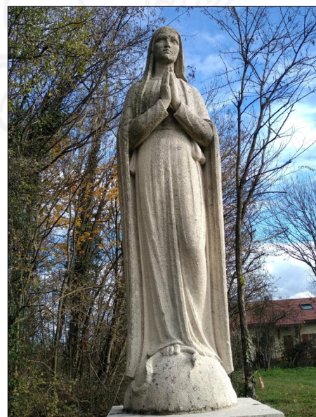
La statue de la Vierge de Charmy va être nettoyée

Des travaux vont aussi être engagés sur la statue de la Vierge de Charmy et son socle afin de les nettoyer et les protéger des outrages du temps. Des devis ont été demandés, et le prestataire sera choisi dans le courant du mois d'avril. Une fois ces travaux effectués, des bancs seront installés, et des arbustes et des plantes vivaces viendront parachever l'ensemble.