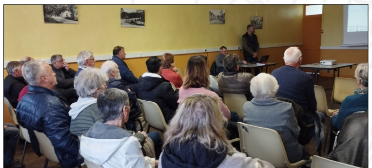
Une réunion a été organisée pour présenter le règlement de stationnement

Les échanges entre la Commune et ses habitants ne se limitent pas à la diffusion d'informations. Certains participent aux comités consultatifs où des propositions sont émises pour être présentées ensuite en réunion du Conseil municipal, en vue d'une éventuelle mise en application. Il s'agit :