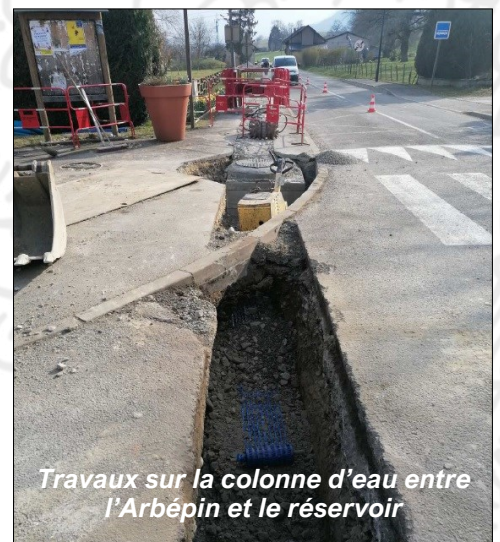
Travaux sur la colonne d'eau entre l'Arbépin et le réservoir