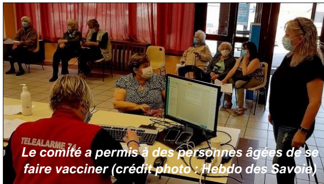
Le comité a permis à des personnes âgées de se faire vacciner

Plus ponctuellement, le comité intervient aussi en soutien des familles ou des personnes rencontrant des difficultés, notamment d'ordre administratif :