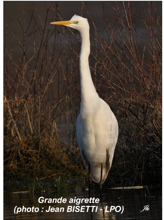
Grande aigrette

Héron gardeboeuf : il accompagne souvent le bétail pour capturer insectes et petits invertébrés dérangés par le piétinement des troupeaux.